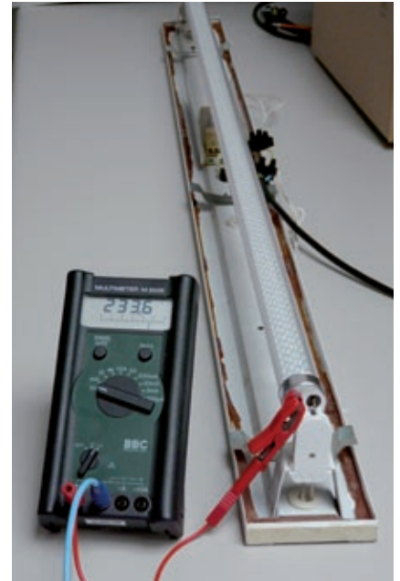
Möglicher elektrischer Schlag bei einseitigem Einführen/Einrasten einer LED-Röhre.